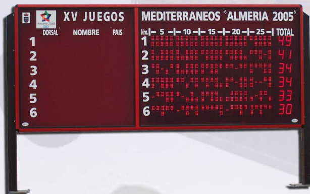
MARCADOR ELECTRÓNICO DE RESULTADOS DE CANCHA MOD. MTS2001